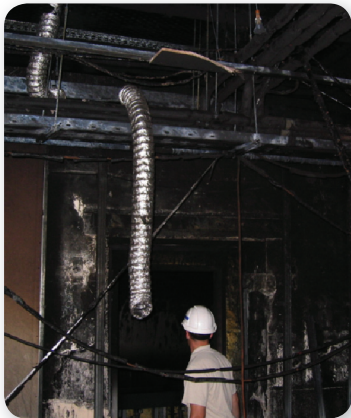
Požiar/výbuch hlavne následkom ľudskej činnosti

Riziká na stavenisku pri realizácii stavebných projektov môžu vzniknúť vo viacerých oblastiach stavebnej činnosti. Kritéria pre hodnotenie týchto rizík sú iné, napr. pre hodnotenie rizík z hľadiska zakladania a spodnej stavby, iné pre hodnotenie rizík vplyvu stavby na okolie stavby a iné pre projektom predpísanú technológiu realizácie stavebného diela. Zárodok niektorých budúcich možných rizík na stavenisku pri realizácii stavebného projektu môžu byť už v prípravnej dokumentačnej fáze. Jedná sa hlavne o správny výber miesta budúcej stavby vo vzťahu ku kvalite stavebného pozemku a o správny výber technológie, jej realizácie vo vzťahu ku osvedčeným pracovným postupom.