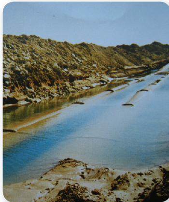
Pôsobenie prírodného živlu /záplava/

Vo všeobecnosti platí, že každé nesprávne rozhodnutie vo fáze prípravnej /dokumentačnej/ sa môže ako riziko prejaviť vo fáze realizačnej.